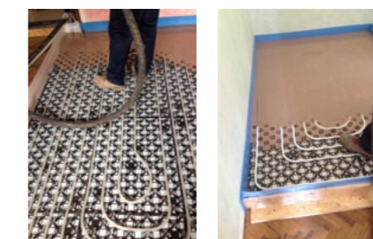
Posa su pavimentazione esistente